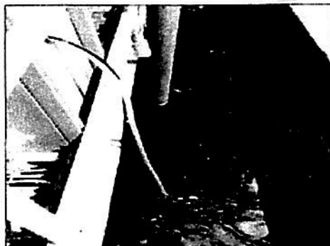
Fotografía 1: Punto de muestreo